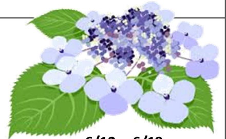
6/12~6/18 紫陽花ウィーク(清高)